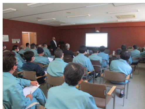
2021年11月20日 事故防止研修会