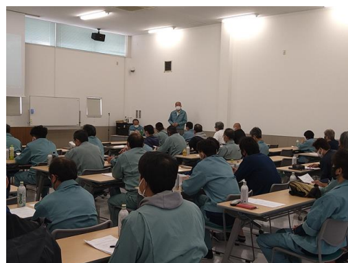
2021年11月6日 事故防止研修会