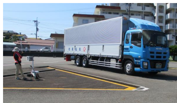
2021年7月22日 ドライバーズコンテスト