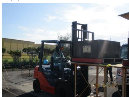
2021年10月30日 リフトコンテスト