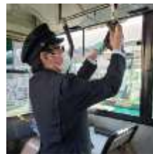
バス車内の消毒風景