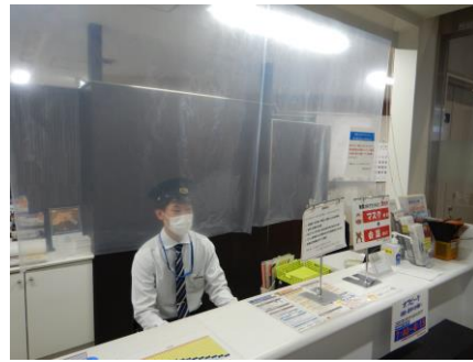
新静岡駅の ウォークイン改札

新静岡・新清水の両駅の改札窓口および新静岡駅の定期券発売窓口に「飛沫飛散防止シート」を設置。