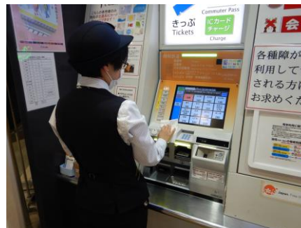
「自動券売機」の消毒清掃