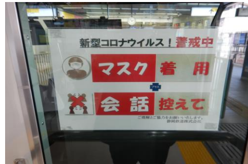
駅構内の掲示および案内表示器