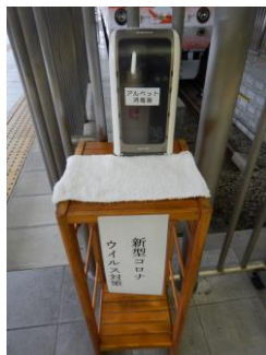
アルコール消毒液

静岡清水線全15駅の改札口付近にアルコール消毒液、改札内のトイレ（入江岡駅以外）に手洗い用石鹸を設置。また、新静岡・新清水駅のハンドドライヤーの使用を中止。