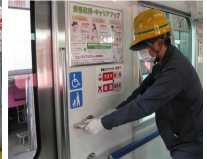
「手すり」の消毒清掃