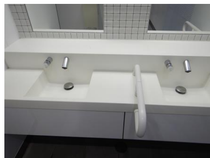
トイレ内の手洗い用石鹸設置