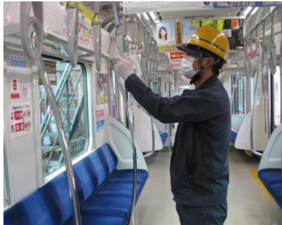
「つり革」の消毒清掃

車両基地に入庫時に、通常の車内清掃に加え、お客様の手指が触れる箇所を除菌水で消毒。