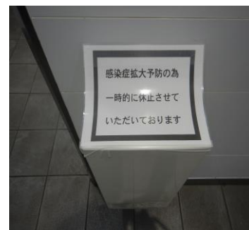
ハンドドライヤーの使用中止