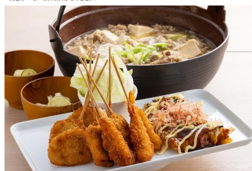
朝食にて大阪名物をご提供