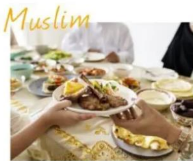
たとえばムスリムの方