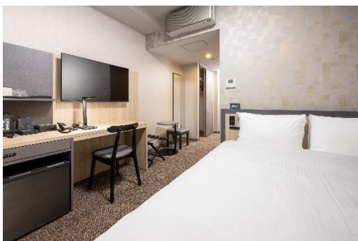
スーペリアダブルルーム