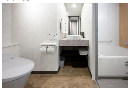
バス・トイレ分離