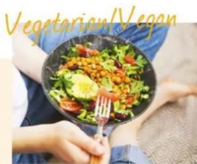
たとえばベジタリアン・ヴィーガンの方